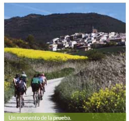
Un momento de la prueba.