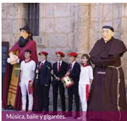
Música, baile y gigantes.