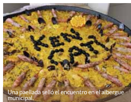
Una paellada selló el encuentro en el albergue municipal.