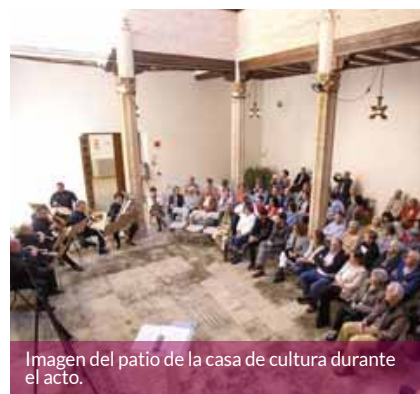
Imagen del patio de la casa de cultura durante el acto.