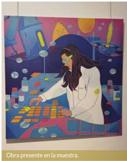
Obra presente en la muestra.