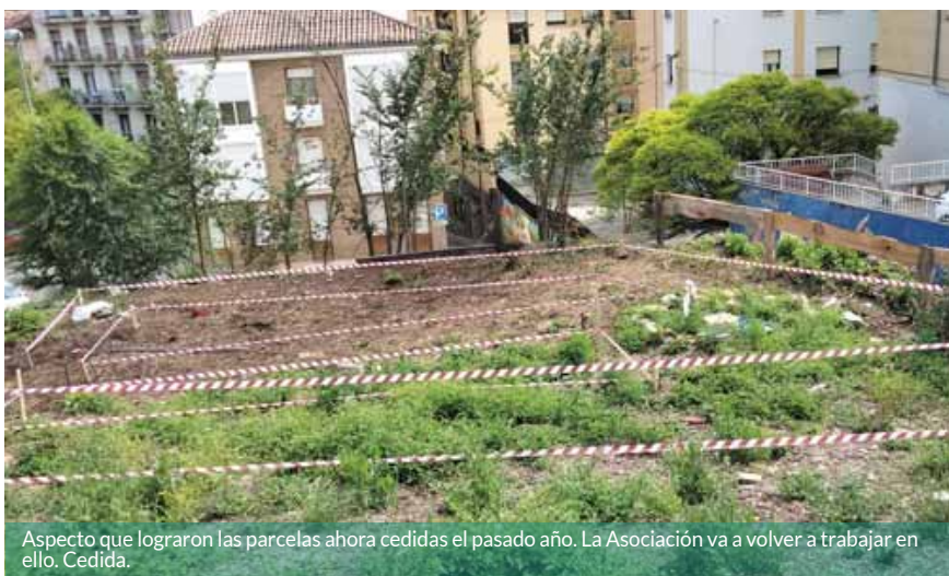
Aspecto que lograron las parcelas ahora cedidas el pasado año. La Asociación va a volver a trabajar en ello. Cedida.

mayor presencia en la ciudad y hacemos ver nuestras demandas”, explican.