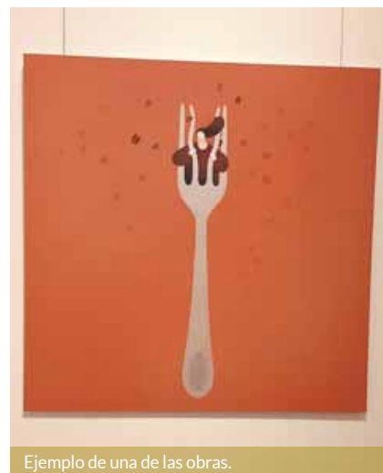
Ejemplo de una de las obras.