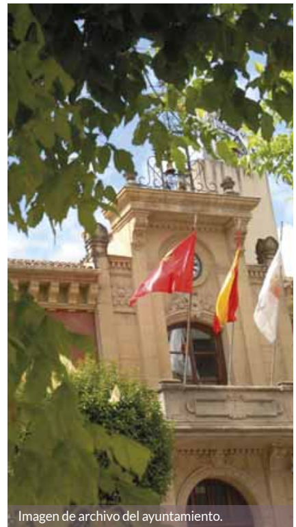
Imagen de archivo del ayuntamiento.