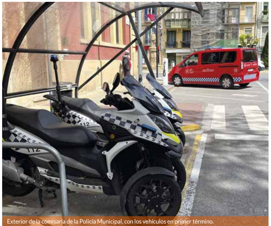
Exterior de la comisaría de la Policía Municipal, con los vehículos en primer término.

El mayor número de las atenciones, 2.556, son denuncias de tráfico, un cuarenta por ciento de ellas, infracciones de estacionamiento