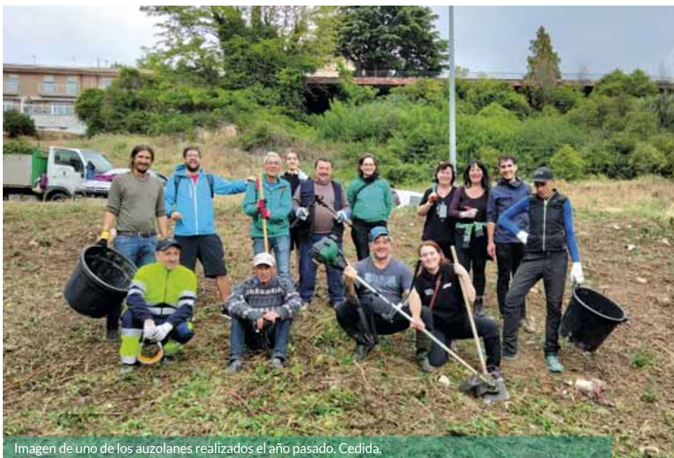
Imagen de uno de los auzolanos realizados el año pasado.

Gracias al colectivo vecinal, el barrio se ha visto representado en diversas cuestiones, y se percibe también una mayor unidad y sentimiento de pertenencia. “Creemos que la pandemia, con las actividades de balcón a balcón, ya marcaron un precedente. Durante este tiempo de unión a través de la asociación, el barrio tiene