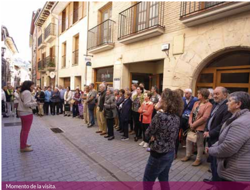
Momento de la visita.