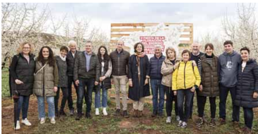
Autoridades y representantes de las diferentes empresas elaboradoras, durante la Fiesta de la Floración del Endrino.

Siete empresas están registradas en la Indicación Geográfica Pacharán Navarro. Elaboran el producto con casi el cien por cien de endrinas cultivadas en la Comunidad foral