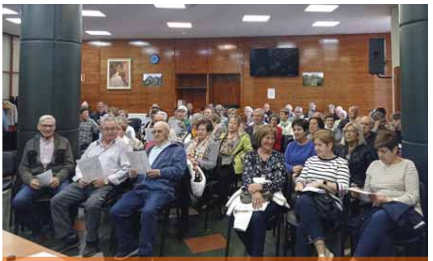
Socios asistentes como público a la reunión celebrada en el salón del centro social.