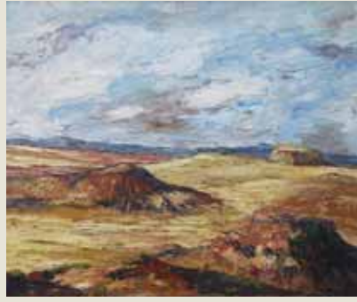
'Bardenas', de José María Monguiot.