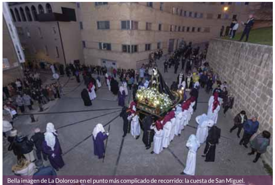
Bella imagen de La Dolorosa en el punto más complicado de recorrido: la cuesta de San Miguel.