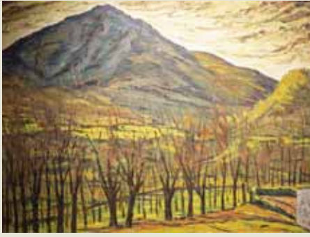
'Montejurra', de Florentino Fernández de Retana.