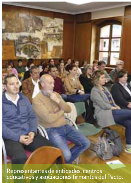
Representantes de entidades, centros educativos y asociaciones firmantes del Pacto.

del compromiso de las administraciones y de las asociaciones” de la ciudad. “Es preciso un esfuerzo colectivo, ser valientes y decididos y no solo firmar acuerdos, después hay que dar ejemplos en el día a día cada uno desde nuestro ámbito”, dijo.