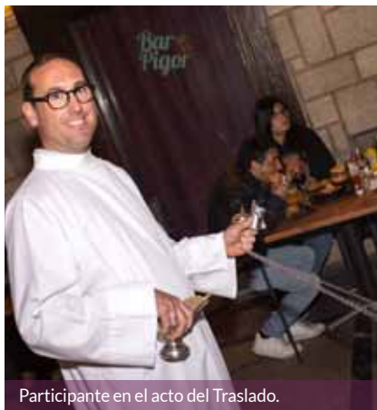
Participante en el acto del Traslado.

El viernes 31 de marzo, a las ocho y media de la tarde, el paso de La Dolorosa, alzado por porteadores de las diferentes cofradías y pasos de la Hermandad, abandonaba la iglesia de San Miguel Arcángel para recorrer la distancia que la separa de la iglesia de San Juan Bautista. La Virgen desfiló en un ambiente de respeto y solemnidad ante un nutrido público que quiso acompañarle en su descenso por la cuesta de San Miguel, las calles La Imprenta, Estrella e hizo entrada en la plaza de los Fueros y en la iglesia de San Juan. Participaban en el acto la Agrupación Musical Estellesa y el solo de trompeta.