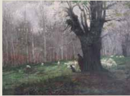
'Vida tranquila', paisaje de Urbasa, obra de Inocencia García Asarta.