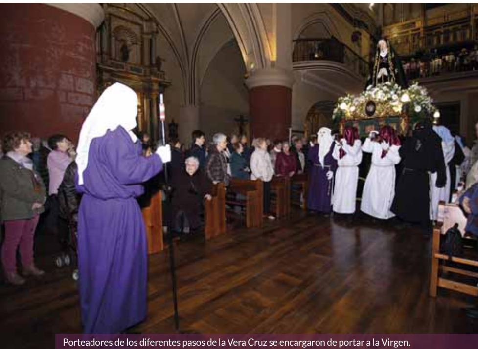
Porteadores de los diferentes pasos de la Vera Cruz se encargaron de portar a la Virgen.