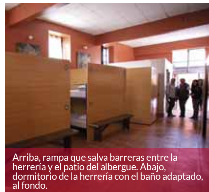
Arriba, rampa que salva barreras entre la herrería y el patio del albergue. Abajo, dormitorio de la herrería con el baño adaptado, al fondo.