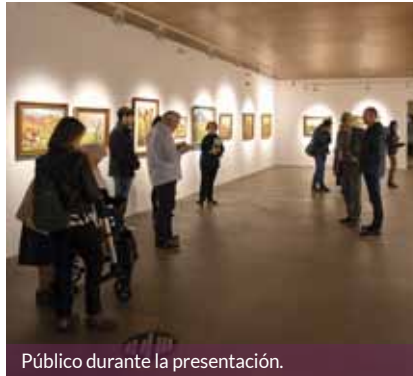
Público durante la presentación.