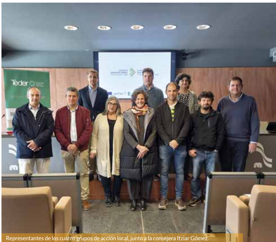
Representantes de los cuatro grupos de acción local, junto a la consejera Itziar Gómez.

La Asociación Teder, los consorcios Eder y Zona Media y Cederna Garalur ponen en marcha un programa que afronta el reto demográfico desde una perspectiva multisectorial