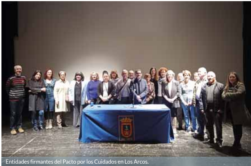
Entidades firmantes del Pacto por los Cuidados en Los Arcos.

Treinta y seis entidades trabajarán conjuntamente para plantear objetivos y poner en marcha acciones en materia de igualdad