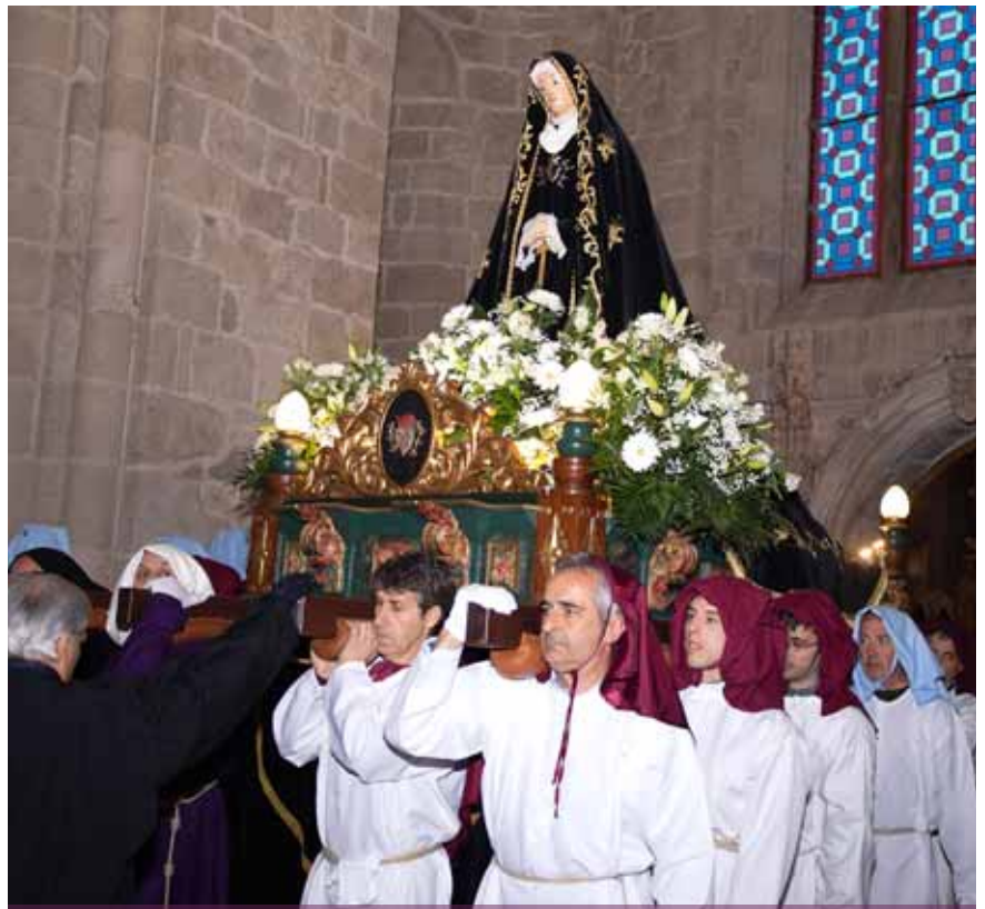
La Dolorosa, embellecida con flores, a punto de salir de San Miguel con la ayuda de los porteadores.

Por último y en relación con los actos de Semana Santa, la Hermandad invita a quien lo desee a visitar el templo del Santo Sepulcro, lugar que alberga los Pasos de la Procesión, el lunes 10 de abril, en el horario de 12 a 14 horas. El resto del año el monumento permanece cerrado.