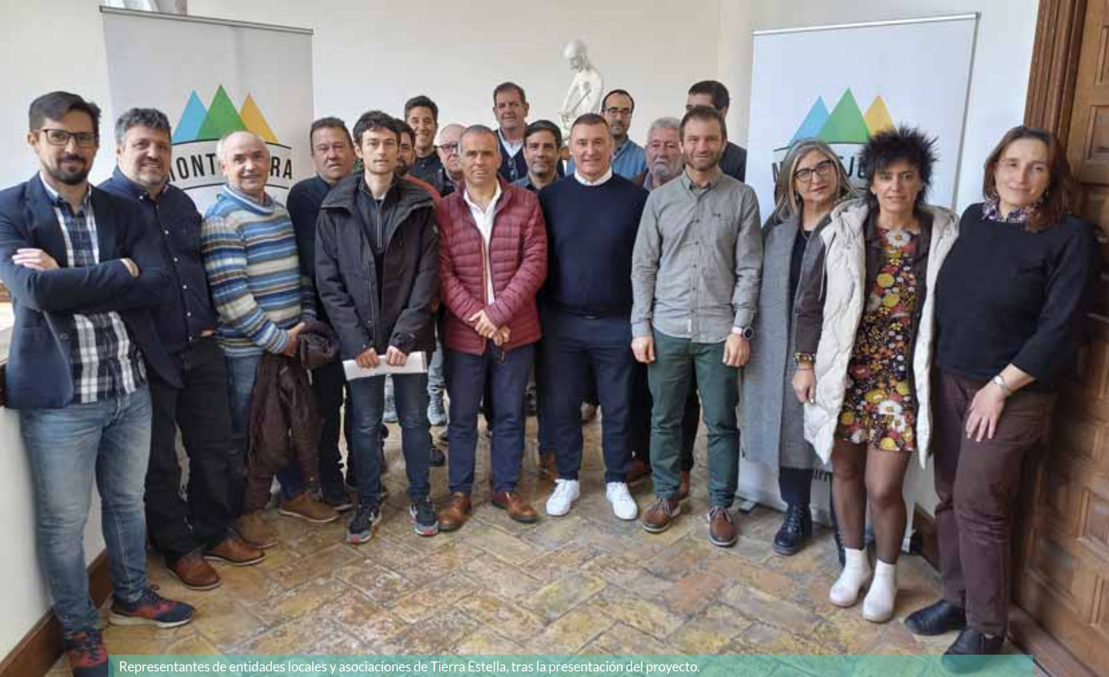
Representantes de entidades locales y asociaciones de Tierra Estella, tras la presentación del proyecto.