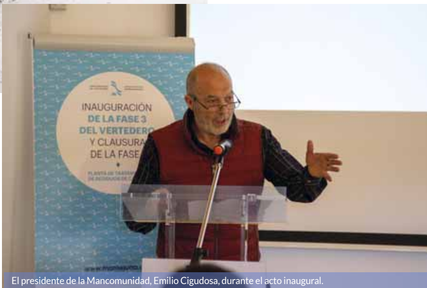
El presidente de la Mancomunidad, Emilio Cigudosa, durante el acto inaugural.