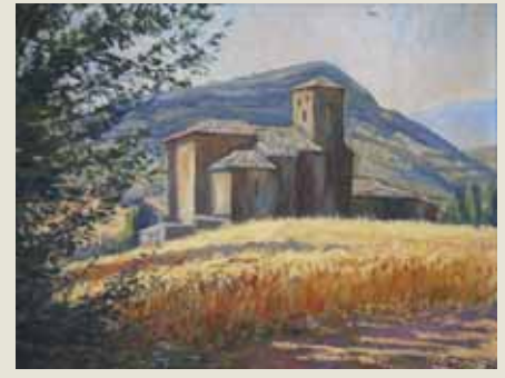
'Ibiricu', de Muñoz Sola.