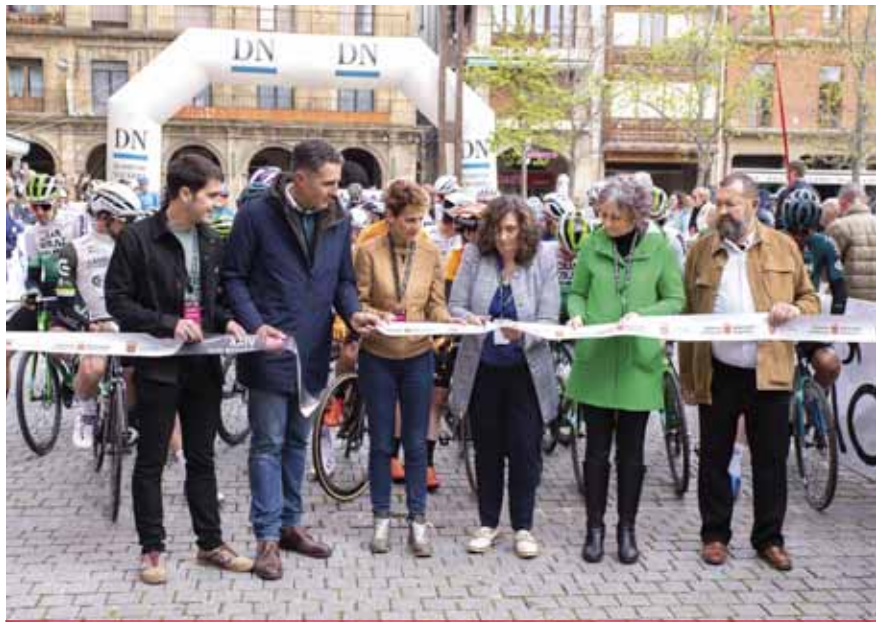
Corte de la cinta por parte de las autoridades.