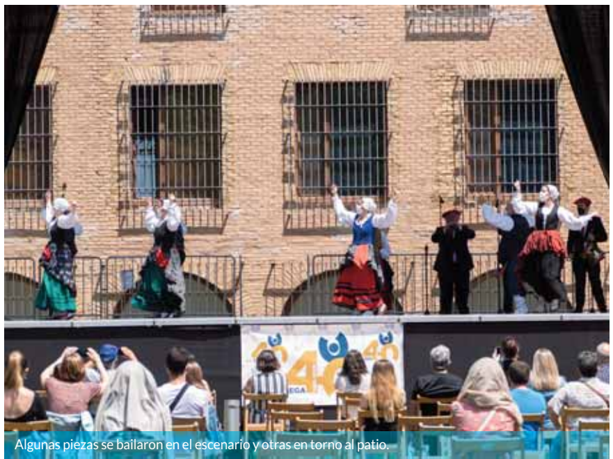
Algunas piezas se bailaron en el escenario y otras en torno al patio.

una nueva coreografía, 'Saludo a Estella-Lizarrako agurra'.