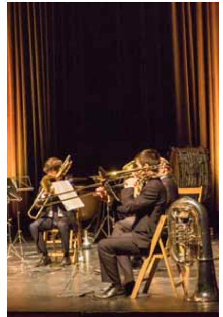
Imagen de archivo del concierto de Navidad ofrecido por algunos miembros de la banda.

“Tuvimos claro que cuanto las cosas mejoraran estaríamos juntos y volveríamos a tocar. Notamos la falta de estar de cara al público, nos da pena que la gente no nos