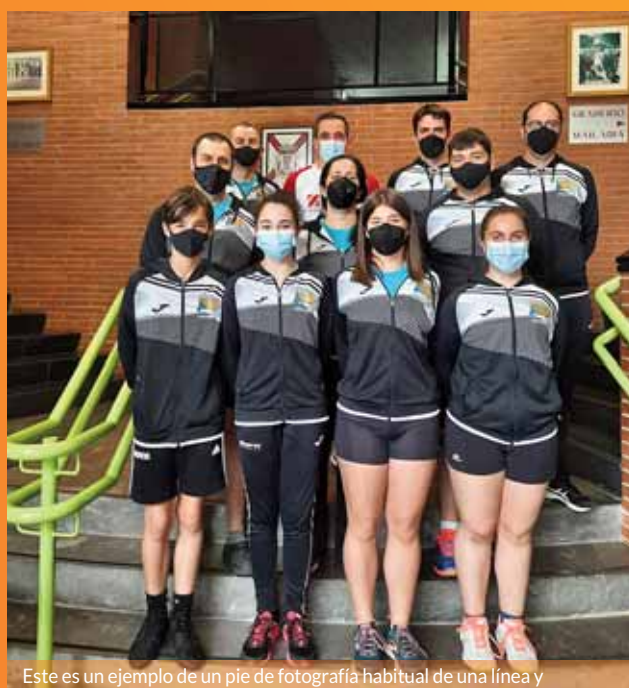
Este es un ejemplo de un pie de fotografía habitual de una línea y