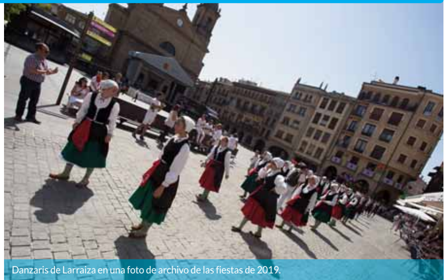
Danzaris de Larraiza en una foto de archivo de las fiestas de 2019.