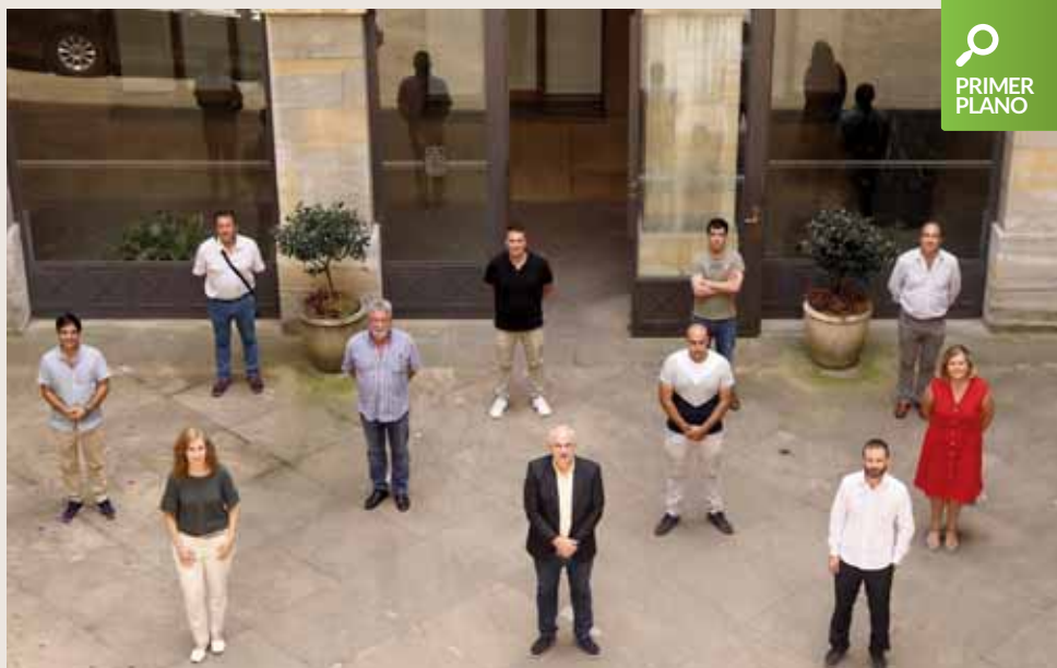
Alcaldes de los once Ayuntamientos de la zona de Montejurra, tras la reunión en Pamplona con Gobierno de Navarra.

Se han establecido tres ejes de actuación. El primero, Montejurra Cohesión, cómo nos gobernamos. Montejurra es un todo que es de to-