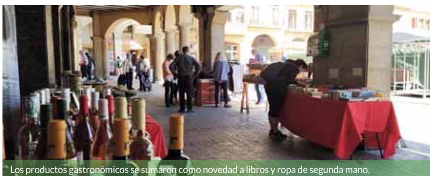
Los productos gastronómicos se sumaron como novedad a libros y ropa de segunda mano.

Una decena de voluntarias de la Asociación mantuvieron abierto el espacio