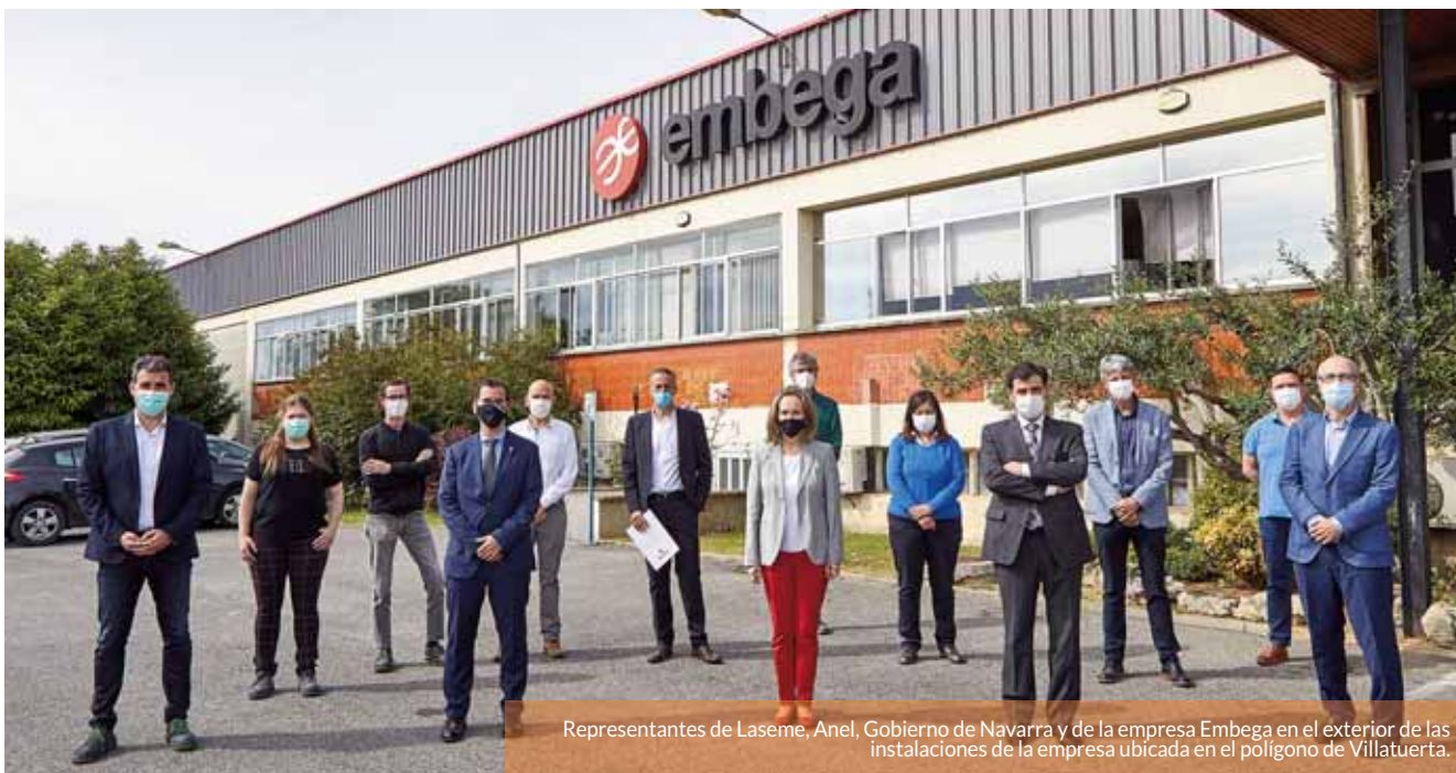
Representantes de Laseme, Anel, Gobierno de Navarra y de la empresa Embega en el exterior de las instalaciones de la empresa ubicada en el polígono de Villatuerta.

Ambas asociaciones se comprometen a cooperar en la detección de empresas en dificultades que puedan ser viables como cooperativas o sociedades laborales