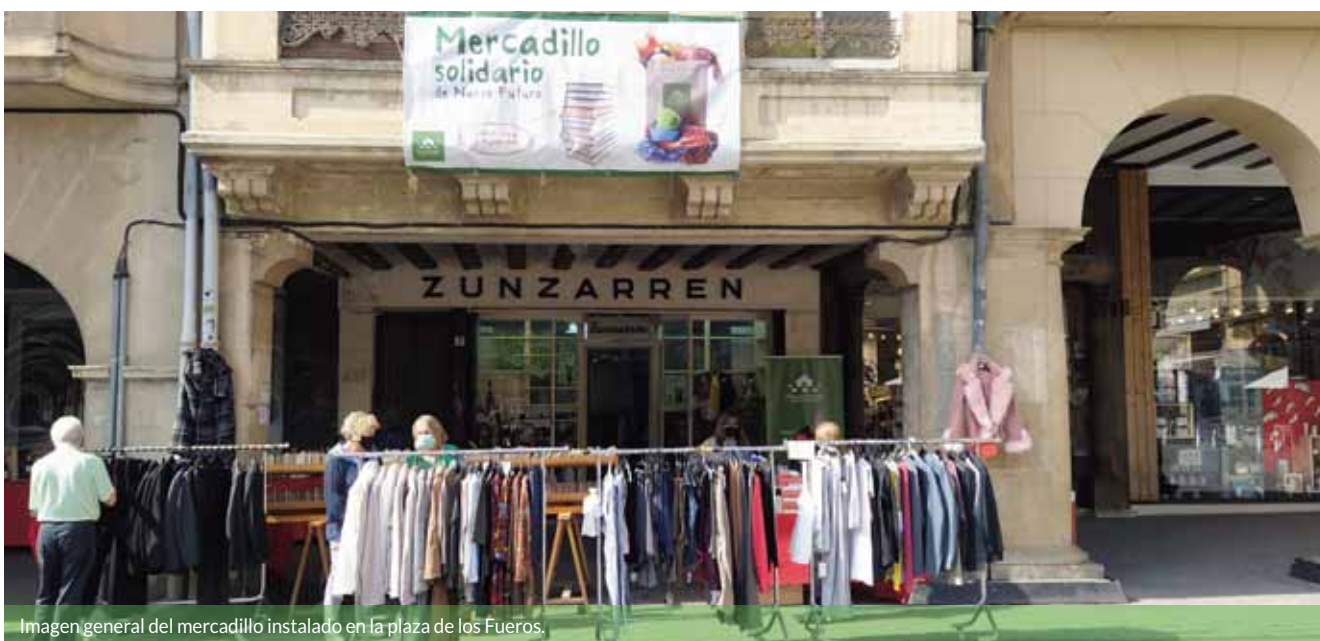
Imagen general del mercadillo instalado en la plaza de los Fueros.

Del 27 al 29 de mayo, la ONG Navarra puso a la venta artículos de ocasión y de segunda mano para conseguir financiación para sus proyectos