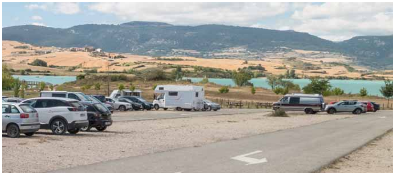
Imagen de archivo del aparcamiento regulado en Lerate.

Los Ayuntamientos de Yerri y de Guesálaz ponen a disposición de los usuarios la aplicación web https://reservas.redexploranavarra.es/ para poder reservar plaza en los aparcamientos de las zonas de baño de Lerate y Ugar, en el embalse de Alloz. El objetivo es mejorar la gestión de esta zona de baño en la temporada alta de verano.