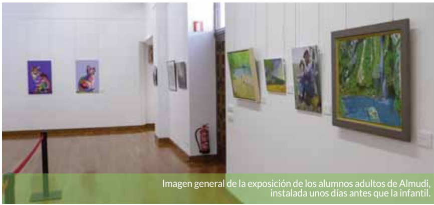
Imagen general de la exposición de los alumnos adultos de Almudi, instalada unos días antes que la infantil.