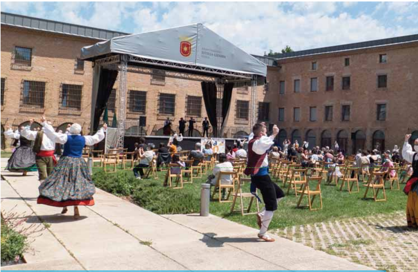
Imagen general del Día del Baile de la Era celebrado en los jardines de San Benito.