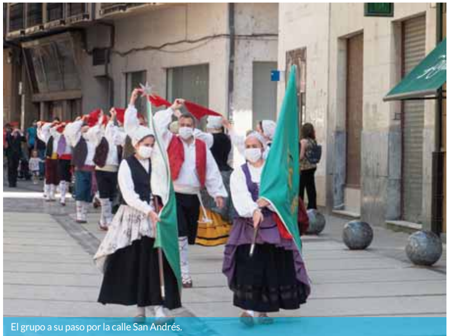
El grupo a su paso por la calle San Andrés.