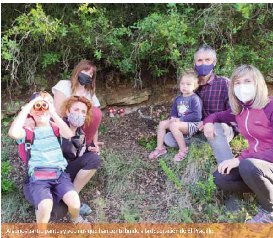
Algunos participantes y vecinos que han contribuido a la decoración de El Pradillo.

Vecinos de la localidad han recuperado un antiguo camino y lo han decorado con pequeñas artesanías para disfrute de los paseantes