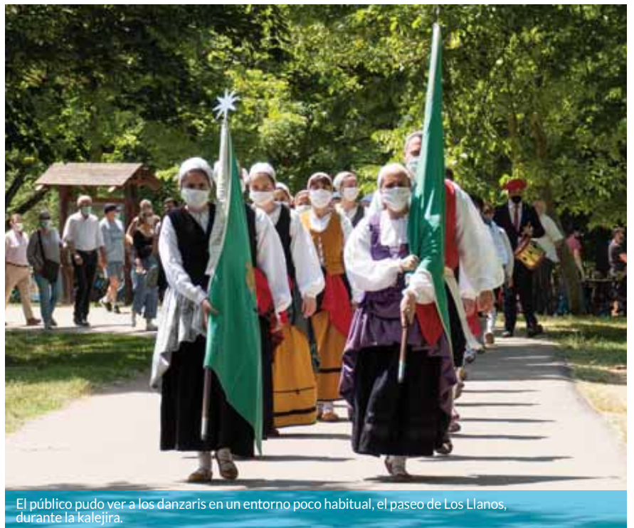
El público pudo ver a los danzaris en un entorno poco habitual, el paseo de Los Llanos, durante la kalejira.

El público disfrutó el 30 de mayo del reencuentro con la danza gracias a la celebración, en un formato diferente al habitual, del XXI Día del Baile de la Era de Estella