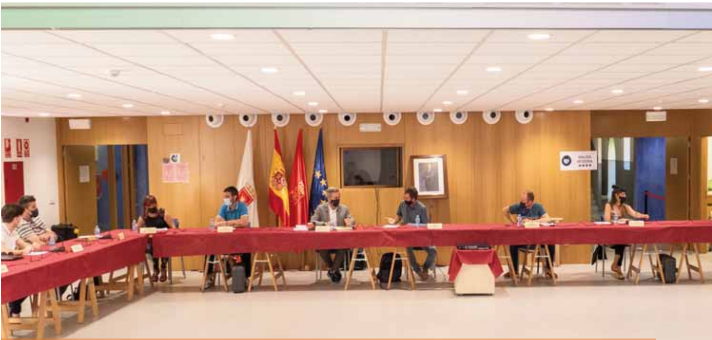
El Pleno volvió a ser presencial en la sesión extraordinaria del 8 de junio, en el salón de actos de San Benito.