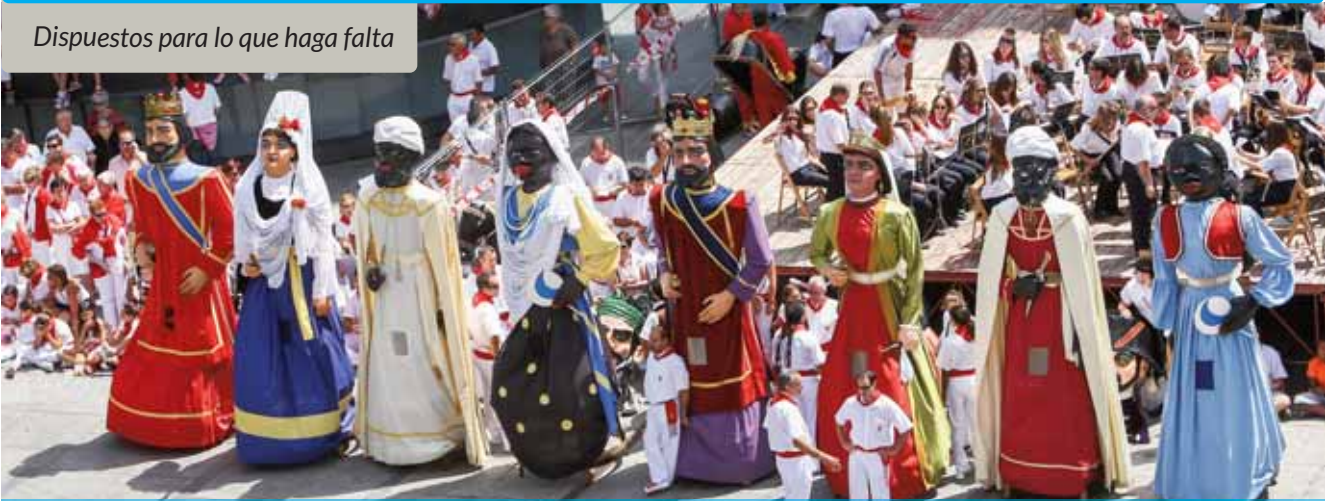
Momento de una de las últimas Despedidas de Gigantes.

La comparsa de Gigantes y Cabezudos de Estella-Lizarra también está activa. En un tiempo sin actuaciones, sus esfuerzos se han centrado en los ensayos, retomados quincenalmente desde el pasado mes de mayo, y en labores de puertas para adentro. En concreto, el colectivo se ha centrado en la renovación de parte de las vestimentas de las figuras; en concreto, se ha restaurado el traje del Rey Negro y se ha empezado a cambiar la ropa de los cabezudos, una labor que ha comenzado con la pareja El Aragonés y La Aragonesa y continuará con el resto.