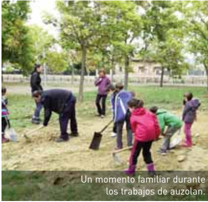
Un momento familiar durante los trabajos de auzolan.

su juego y reconocer sus gustos e intereses para propiciar el objetivo final: el diseño de un parque infantil atractivo.