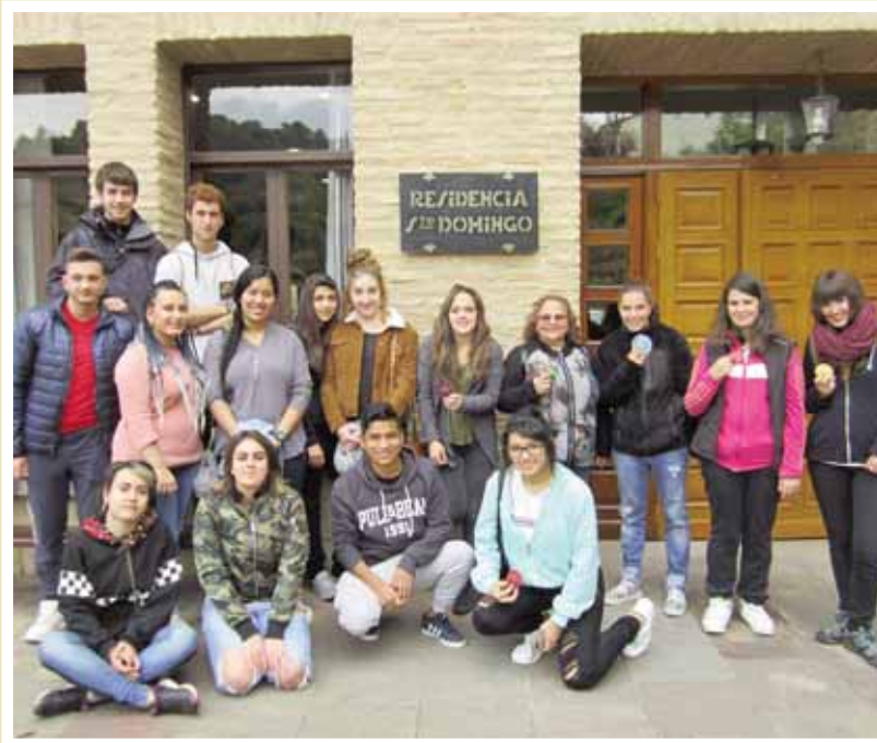
> Visita a la residencia Santo Domingo Los alumnos del nuevo ciclo de Atención a Personas en Situación de Dependencia del C.I. Politécnico Estella realizaron una visita a la residencia de Santo Domingo para conocer la organización y funcionamiento del centro. Envían esta foto.