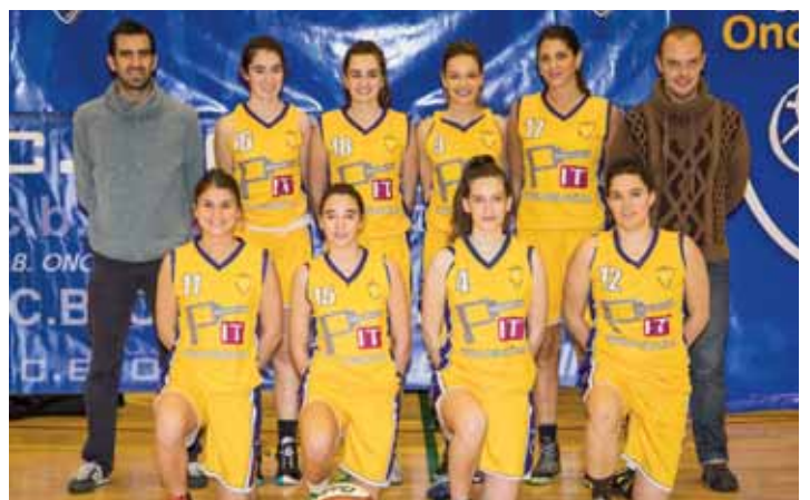
PROYECTA IT - ONCINEDA SENIOR FEMENINO 2ª DIVISIÓN NACIONAL