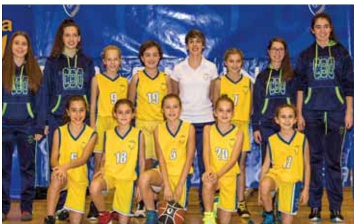
PRE MINI FEMENINO