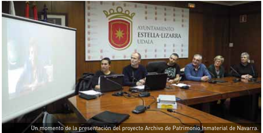
Un momento de la presentación del proyecto Archivo de Patrimonio Inmaterial de Navarra.

EL PROYECTO, CON TRES AÑOS DE DURACIÓN, SE BASARÁ EN ENTREVISTAS A 90 PERSONAS MAYORES PARA INTENTAR RECREAR LA VIDA DE LA CIUDAD EN EL ÚLTIMO SIGLO