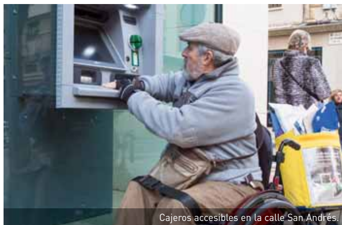
Cajeros accesibles en la calle San Andrés.

te de San Juan, la plaza de la Coronación, la de los Fueros y la calle de la Rúa. El grupo también paró en el centro de salud.