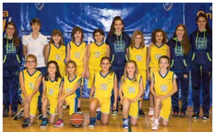
PRE MINI FEMENINO