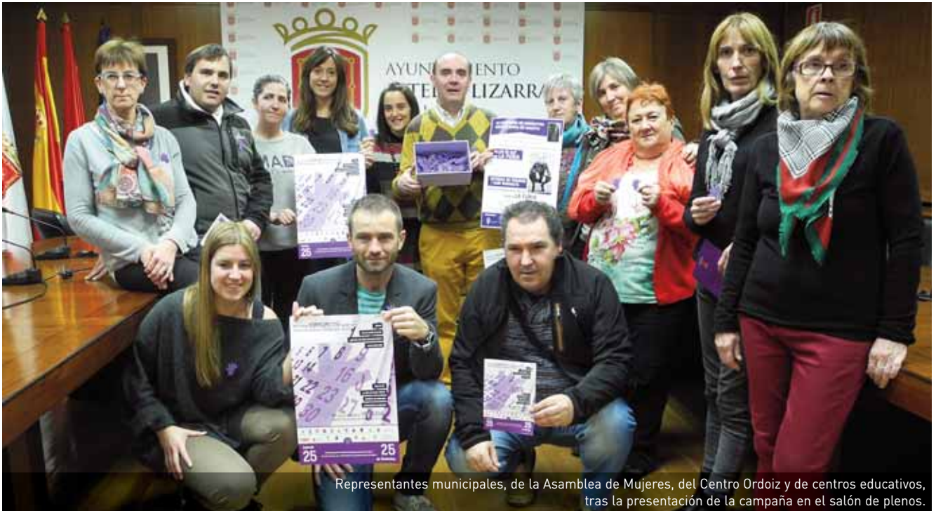
Representantes municipales, de la Asamblea de Mujeres, del Centro Ordoiz y de centros educativos, tras la presentación de la campaña en el salón de plenos.