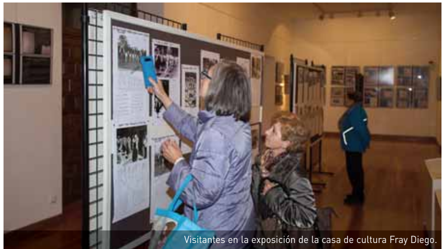
Visitantes en la exposición de la casa de cultura Fray Diego.

EL PÚBLICO PUEDE VISITAR HASTA EL 20 DE NOVIEMBRE EN LA CASA DE CULTURA UNA MUESTRA FOTOGRÁFICA Y DOCUMENTAL QUE RECORRE LA HISTORIA DE LA DANZA DESDE FINALES DEL SIGLO XIX HASTA 1966