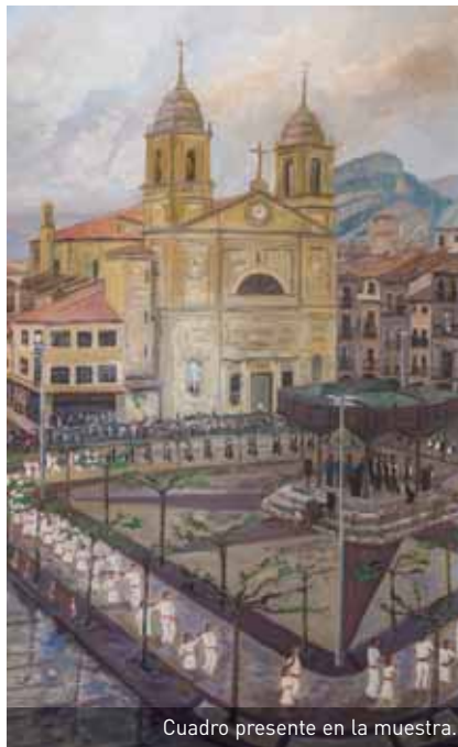
Cuadro presente en la muestra.

La idea de organizar la exposición sobre el Baile de la Era surgió del Taller de la Danza de Tierra Estella en el contexto de un programa monográfico sobre el baile durante el mes de mayo. Las actividades del Taller continúan el 10 de diciembre con la celebración de la tercera edición de su 'Bazkaria eta bailoteo'. En torno a 200 personas procedentes de diferentes lugares