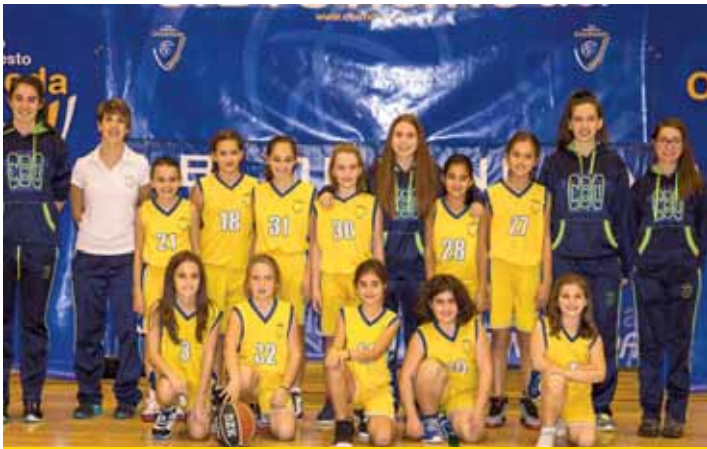
PRE MINI FEMENINO