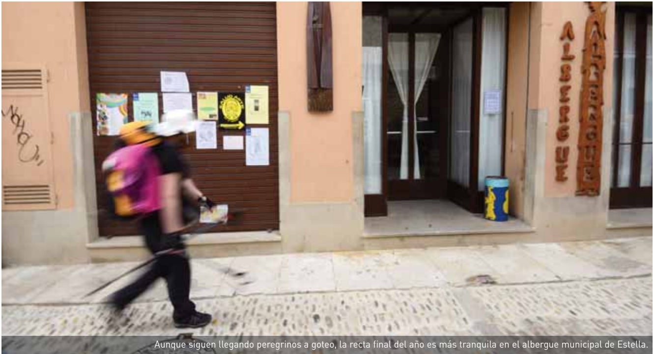
Aunque siguen llegando peregrinos a goteo, la recta final del año es más tranquila en el albergue municipal de Estella.

DESDE ENERO HASTA EL 15 DE NOVIEMBRE, EL ESTABLECIMIENTO QUE GESTIONA LA ASOCIACIÓN AMIGOS DEL CAMINO DE SANTIAGO DE ESTELLA HA RECIBIDO 19.390 VISITANTES