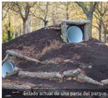
Estado actual de una parte del parque.

La iniciativa comenzaba a gestarse el pasado mes de marzo, con un trabajo previo en tres talleres. Durante tres encuentros los niños pudieron experimentar el juego a través de materiales convencionales, no de juguetes, lo que permitió poner sobre la mesa sus demandas y necesidades. Cada una de las tres sesiones reunía en el centro de jubilados de la localidad a cerca de 40 niños.