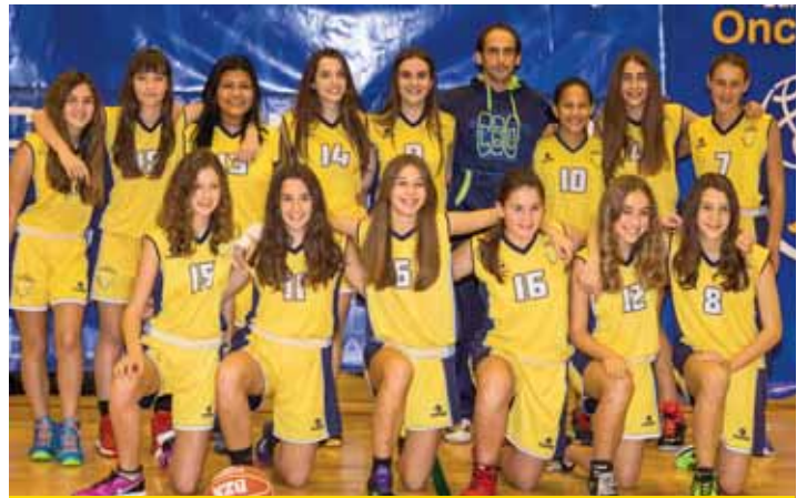
CADETE FEMENINO 2ª