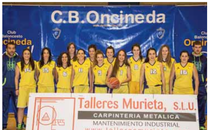
SENIOR FEMENINO AUTONÓMICA