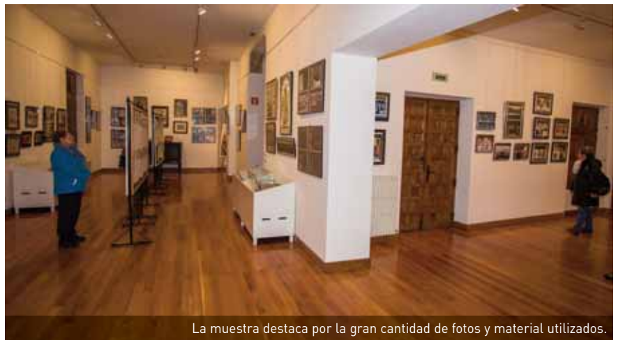
La muestra destaca por la gran cantidad de fotos y material utilizados.

LA ACTIVIDAD LA HA ORGANIZADO EL TALLER DE DANZA POPULAR DE TIERRA ESTELLA