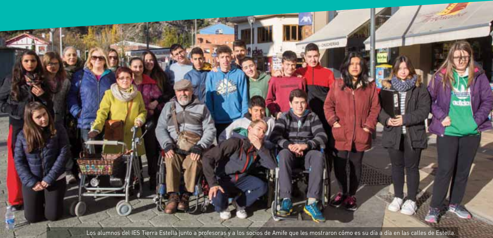
Los alumnos del IES Tierra Estella junto a profesoras y a los socios de Amife que les mostraron cómo es su día a día en las calles de Estella.