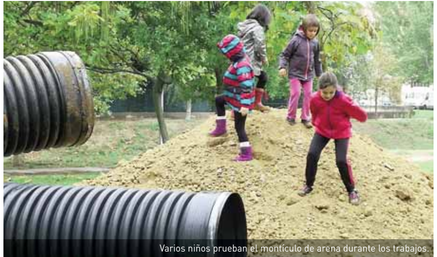
Varios niños prueban el montículo de arena durante los trabajos.

La nueva zona de juego se ha habilitado en la trasera del centro de salud, junto al lugar donde patinan y donde también se encuentra un parque de juego de módulos convencional. La creación del nuevo espacio la impulsa el Ayuntamiento con el acompañamiento de Txusma Azcona, director de la Escuela Infantil municipal Arieta, de Estella. El diseño se inspira en la filosofía y en las propuestas de pedagogo italiano Francesco Tonucci, así como en los movimientos 'slow', de vuelta a la calma y en defensa del desarrollo de las personas.