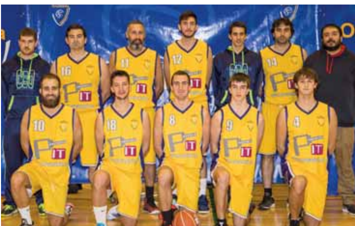
PROYECTA IT - ONCINEDA SENIOR MASCULINO 2ª INTERAUTONÓMICA