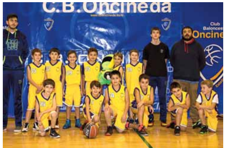
PRE MINI MASCULINO