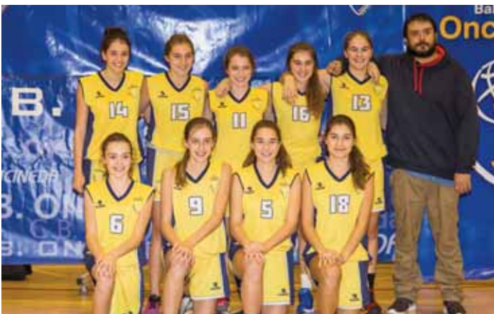
CADETE FEMENINO 1ª