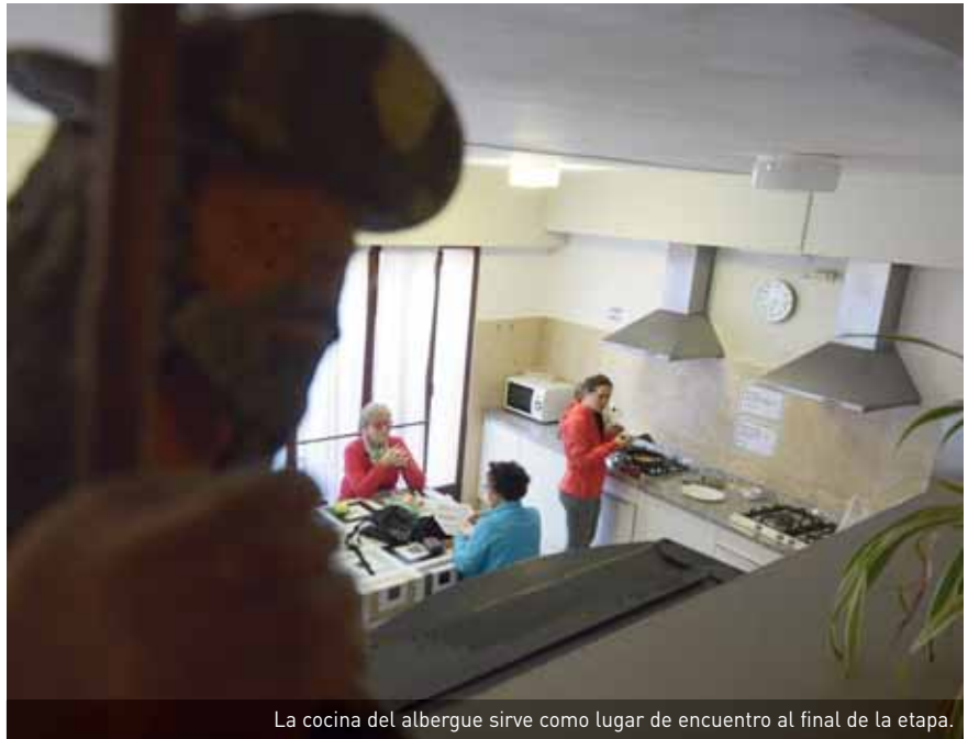
La cocina del albergue sirve como lugar de encuentro al final de la etapa.

En este 2016, Italia ha sido la nacionalidad con mayor presencia (2.463 personas), seguida de Estados Unidos (1.498) y de Corea en tercera posición (1.436). Alemania ocupa el cuarto puesto (1.379) y Francia desciende al quinto desde los puestos punteros en campañas anteriores (1.207). Completan por orden el top 10 Reino