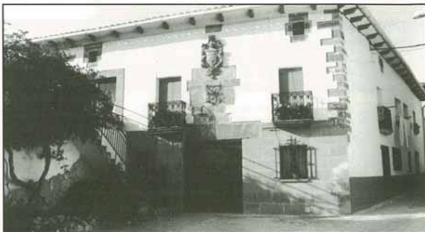
Aspecto exterior de la casa rural de Abárzuza.