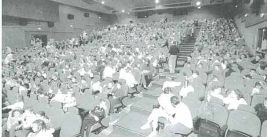
Los cines Los Llanos de Estella recibieron a 5.600 niños de toda la Comunidad foral.

Una noche, el príncipe Iván recorría el bosque, y de pronto se encontró con el hermoso pájaro de fuego. Iván, maravi-