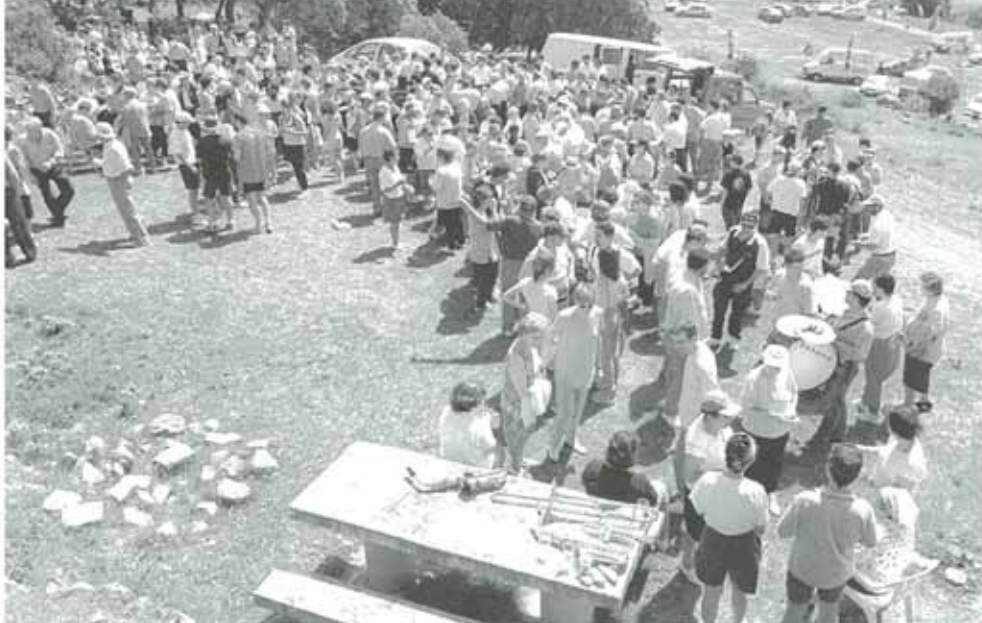
Los vecinos de Villatuerta renovaron la tradicional romería hasta el alto de Mauriain.

La cruz de Mauriain, que tiene unos ocho metros de altura, fue construida en el lugar en el año 1933. Era un