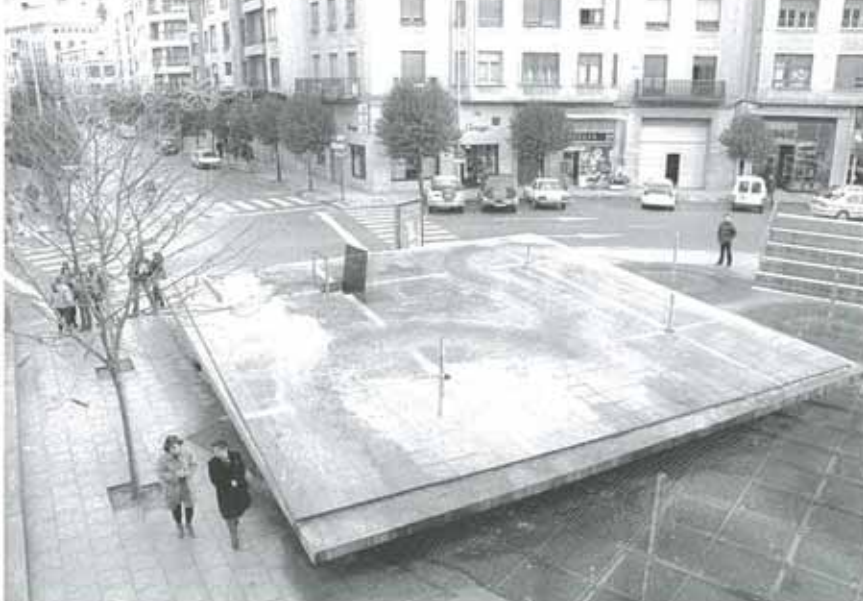
La plaza de la Coronación tampoco ha entrado dentro de las modificaciones del Plan Trienal.

- Lezaun: renovación de alumbrado público (18.434); pavimentación de las calles Mayor, Trinidad y San Pedro (14.827); reforma de la casa consistorial (23.810); pavimentación del cementerio (2.105), y ampliación del cementerio (19.919).