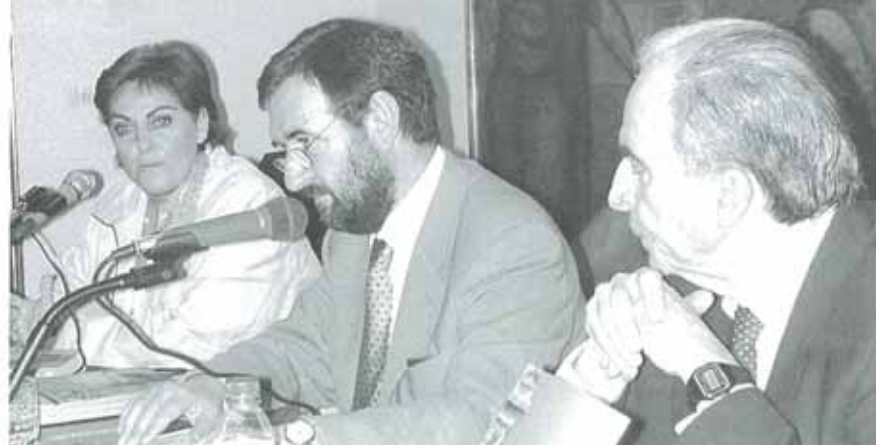
Corpas, Director General de Cultura del Gobierno de Navarra, destacó la idoneidad del tema de este año, 'Señores, siervos y vasallos en la Alta Edad Media'.

La iniciativa se enmarca dentro de otra a nivel nacional, en la que se celebra el Día de las Vías Verdes. Aunque ese día era el 13 de mayo, los organizadores prefirieron trasladarlo para evitar las elecciones en el País Vasco y que los visitantes de esa zona no viniesen a la marcha.