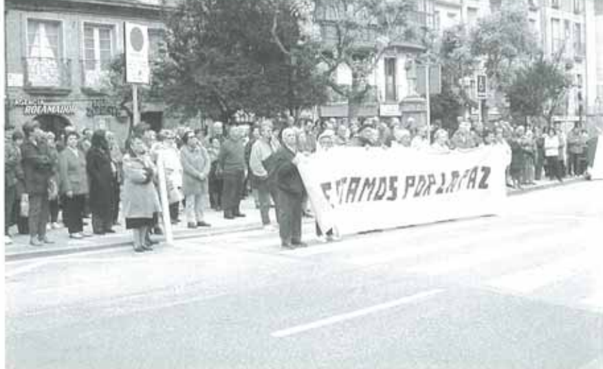
La concentración fue más numerosa que en anteriores ocasiones

Realiza unos días de descanso para cuidarte: una escapada de fin de semana es una buena idea. Lo primero eres tú, no pienses tanto en los demás. Momentos dulces con tu pareja: aprovéchalos.