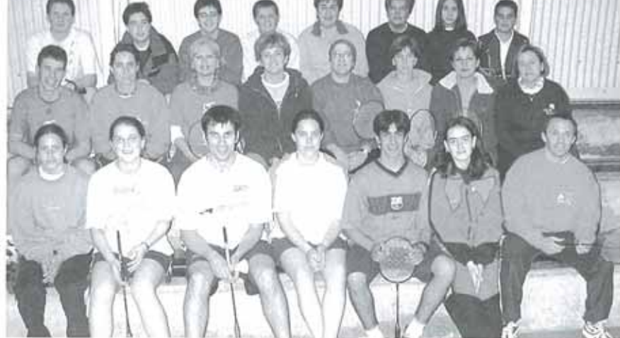
Algunas de las personas que normalmente entrenan en la ciudad.