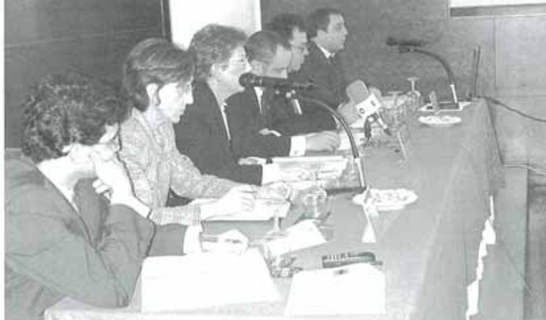
La asociación, Laseme, pretende aglutinar a 100 empresas en un periodo de dos años.

"Conscientes de las posibilidades de la merindad en cuanto a desarrollo y oportunidades, nace Laseme, con una clara e inquieta vocación que busca, por un lado, dar a conocer la capacidad empresarial de la zona a todos los niveles, empezando por la propia comunidad foral, procurando igualmente atraer nuevas iniciativas de ne-