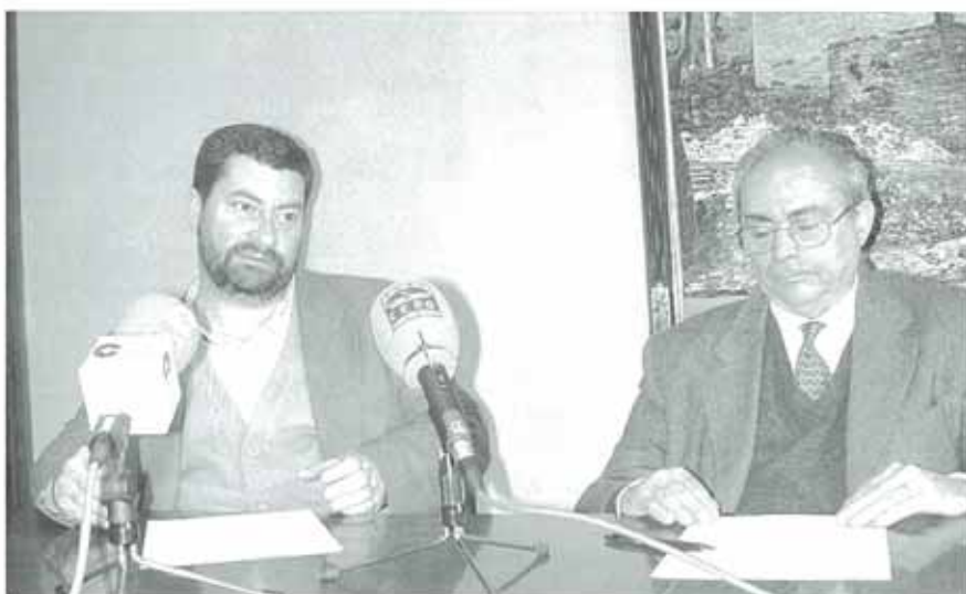
Representantes de la Asociación de Amigos del Camino de Santiago de Estella presentaron la Semana.