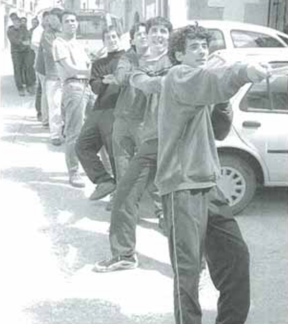
Los jóvenes de la localidad son los encargados de cortar e izar el chopo, y de poner nombre al muñeco.

Pero poco estuvo el muñeco colgado. Por la tarde, reunido el Ayuntamiento en sesión urgente, se acordó retirarlo "debido a la gran división creada entre los propios vecinos de Murieta". En dicho acuerdo se señalaba que "el Ayuntamiento de Murieta nunca ha intervenido en la decisión del personaje a colocar en