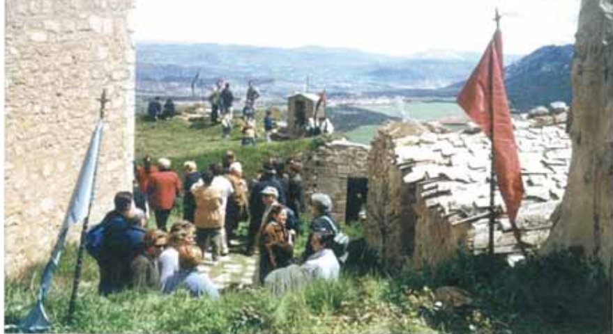
El lugar está considerado como el emplazamiento donde están las tumbas de algunos de los primeros reyes de Navarra

Es única pieza románica de orfebrería navarra, junto con el Evangelario de Roncesvalles, y pese a la última restauración, que le ha afectado sustancialmente, sobre todo en el aspecto decorativo, continua siendo una de las piezas más impresionantes de la orfe-