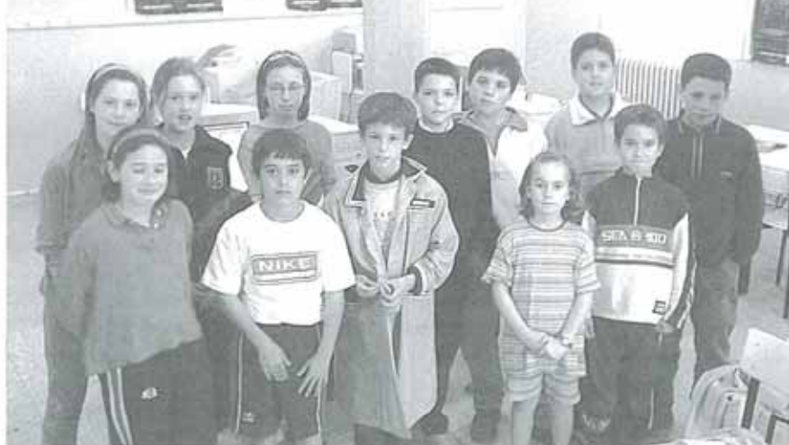
Los alumnos, que pertenecen al colegio Santa Ana, han experimentado con la informática desde una temprana edad.

Por de pronto, todos ellos, mayores y pequeños, cuando menos escriben a máquina con una soltura impropia de su edad. Son capaces de utilizar Word para escribir cartas o cualquier otro tipo de documento, incluyendo en ellos algunas de las características más complejas, como pueden ser la utilización de tablas. También manejan con soltura el Paintbrush, herramienta básica de dibujo, y algunos han hecho sus pinitos en el retoque de fotografías, aplicando diversos filtros a sus propias instantáneas. El entorno de Win-