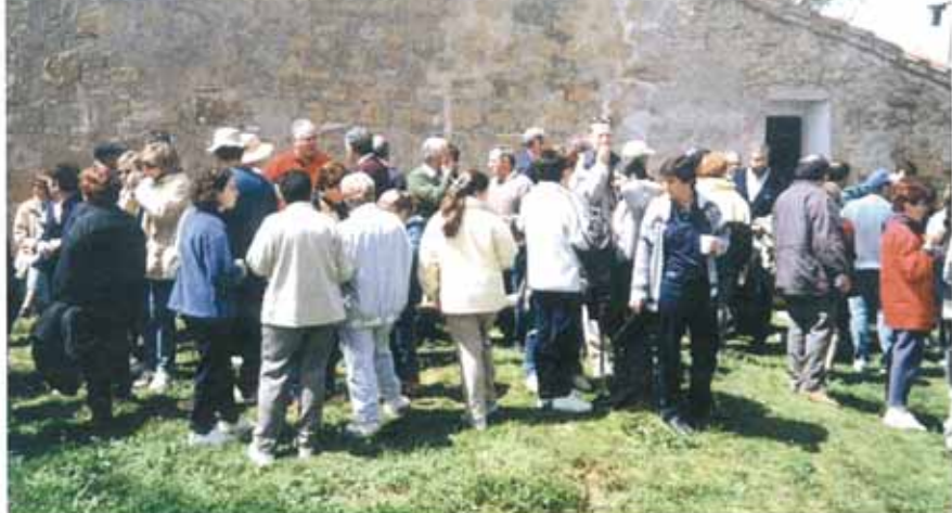
Numerosos vecinos degustaron el almuerzo que se había preparado en la cumbre de Monjardin, antes de regresar a Villamayor

El buen pastor dejó la cruz en el enebro y gozoso fue a comunicar el hallazgo a su amo. Éste, con el gozo recibido por la noticia, se olvidó de comunicarla a nadie. Y en solitario con su pastor se trasladó al lugar milagroso. Llegados al enebro notó el pastor