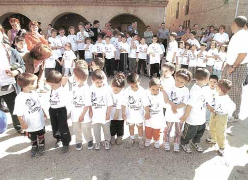
El cross infantil contó con la participación de 78 chavales y chavalas. Todos recibieron premio en la meta