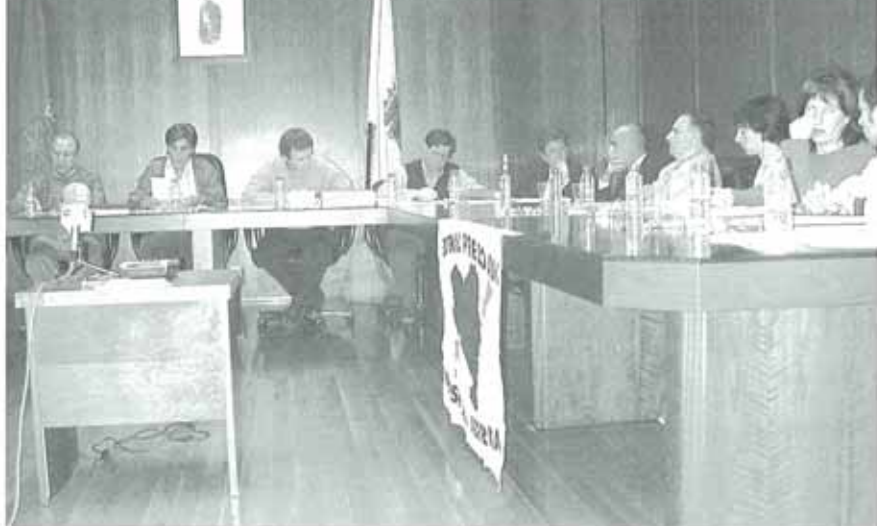
El pleno tuvo una duración cercana a las dos horas, y acudieron todos los concejales

La segunda moción hizo referencia a la falta de un/a técnico que sepa euskera en el museo Gustavo de Maeztu, como venía ocurriendo hasta la fecha. También a que en la biblioteca pública de Estella no exista ninguna suscripción a prensa en euskera. Los partidos votaron a favor de solucionar esas situaciones, excepto UPN y PSOE, que esgrimieron el mismo