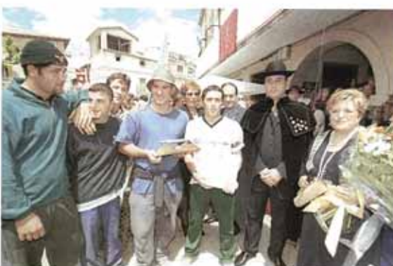
Los ganadores al mejor espárrago presentado, posan junto al trofeo