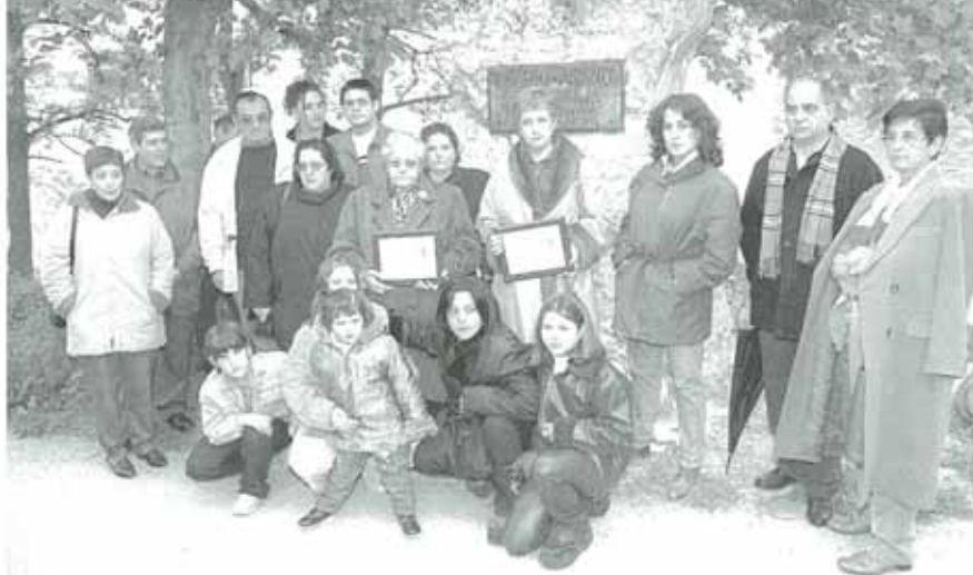
Los familiares de los dos fallecidos posan junto al monolito que representa su perpetua memoria.

El Ministerio del Interior del Gobierno de España denegó, hace escasas fechas,