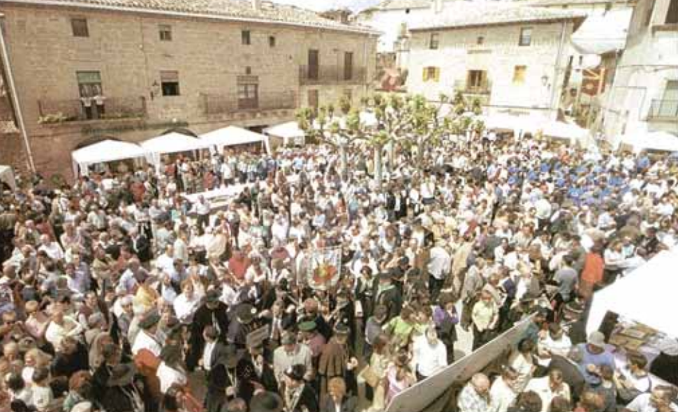
Ni siquiera el txupínazo en las fiestas patronales congrega a tanta gente en este lugar de Dicastillo