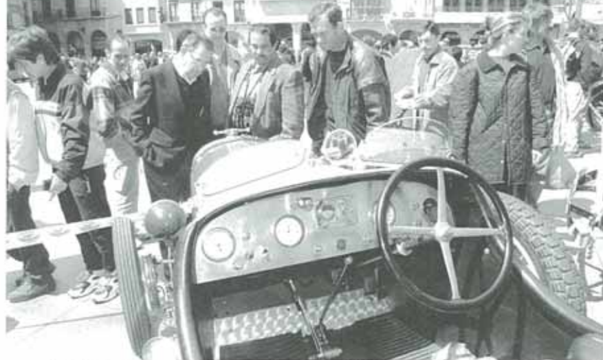
Los modelos causaron admiración entre los presentes debido a su excelente estado de conservación.