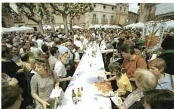
La plaza de los Fueros se queda pequeña para acoger a vecinos y visitantes

Los actos del día tuvieron varios puntos álgidos, en los que el espárrago, como no podía ser de otra forma, fue el protagonista indiscutible. La parroquia de San Emeterio y San Celedonio acogió el XI capítulo de la 'Cofradía del Espárrago de Navarra'. En un marco incomparable, como lo es el templo de la