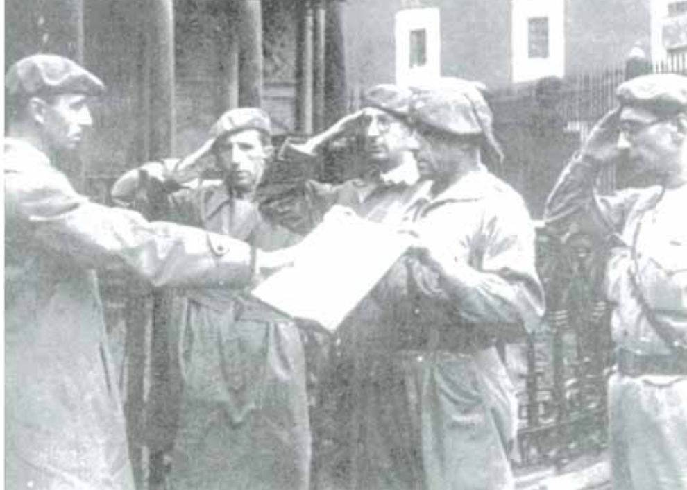
Carlos Hugo Jurando los fueros vascos junto al roble de Gernika.

Los primeros carlistas comenzaron a llegar a la cima y fueron recibidos por Sixto y sus seguidores, apuntándoles con diversas armas. Habían colocado una ametralladora con un trípode cercana a la explanada donde se sitúa la gruta del Cristo Negro. Los carlistas cada vez eran más, y ante el abucheo que se produjo hacia los ultras que ocupaban la cumbre, estos comenzaron a disparar a la orden de