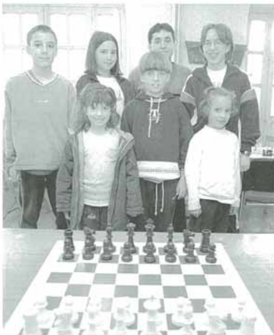
Algunos de los campeones posan junto a compañeros y su profesor