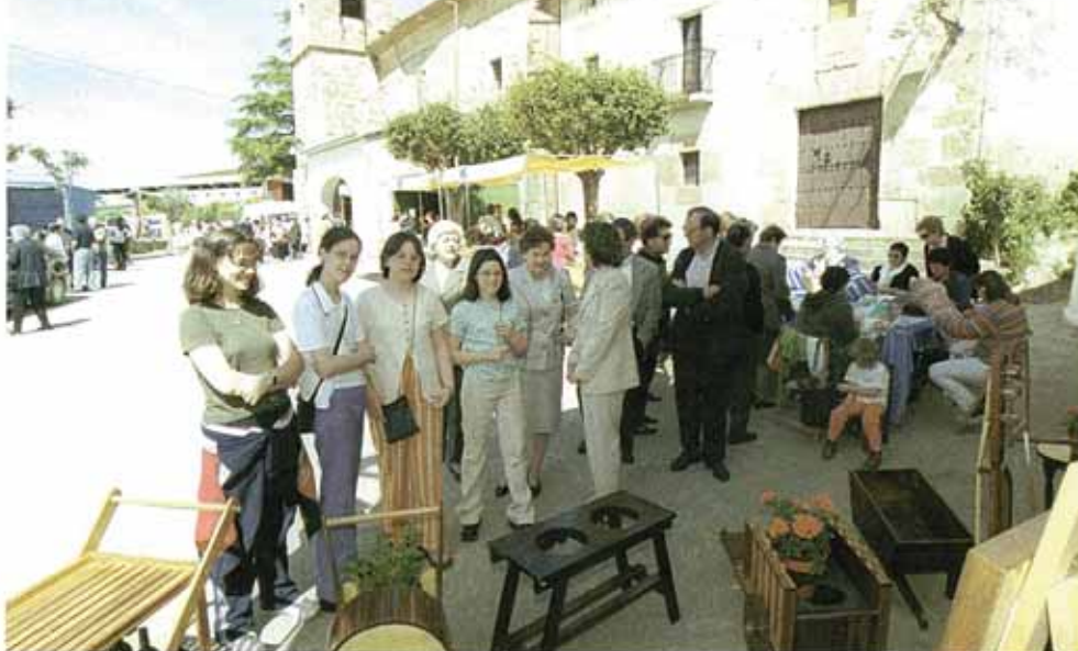
Vecinos de todos los concejos se dieron cita en Zubielqui para celebrar el Día de Allín y Metauten

53 habitantes tiene la capital del distrito. Se sitúa en un llano y dentro de su casco urbano destacan algunas casas blasonadas y palacios de los siglos XVI a XVII. En su término se halla la ermita de Santa Bárbara.