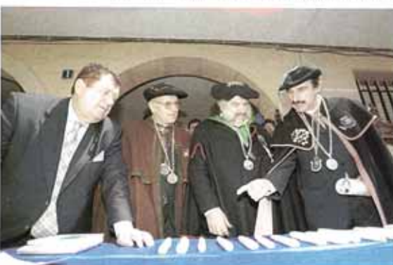
El jurado estuvo dudando entre los ejemplares 15 y 16.