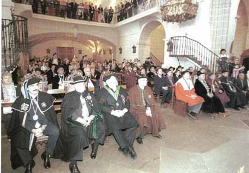
Representantes de ocho cofradías se acercaron hasta la Iglesia de San Emeterio y San Celedonio para ser entronizados como nuevos miembros de la Cofradía del espárrago de Navarra