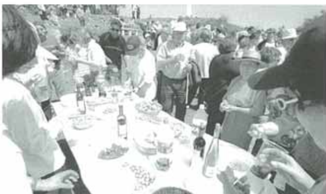
El almuerzo lo ponía el Ayuntamiento de la villa.

La cruz, situada en el término del mismo nombre, fue escenario de una misa y posterior almuerzo para unas 700 personas