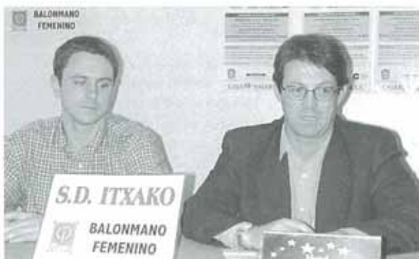
Los directivos del equipo afirmaron que el Itxako irá a por todas

La jornada se iniciará a las doce de la mañana con la recepción a las jugadoras y técnicos de los diferentes equi-