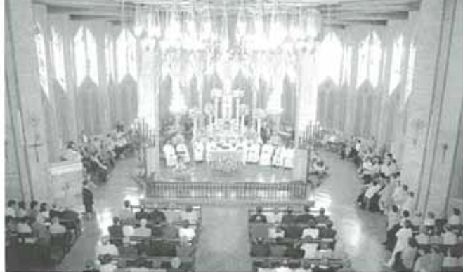
La basílica volverá a quedarse pequeña para recibir a todos los fieles.

La actual basílica de la Virgen del Puy de Estella fue inaugurada en 1952, por lo que el próximo año se cumple el primer medio siglo de existencia del