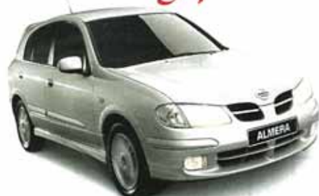
Almera 3 y 5 puertas.