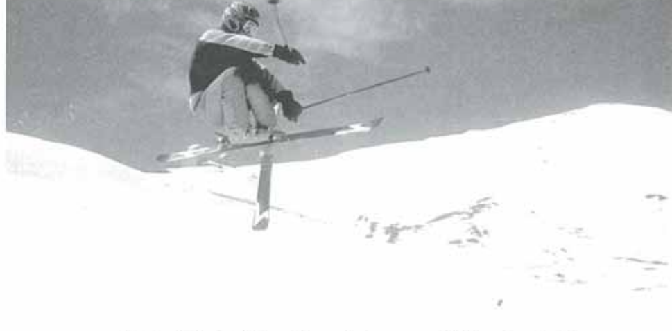
La espectacularidad de los saltos queda claramente reflejada en las dos imágenes que nos han cedido los aficionados, de ejercicios realizados esta temporada

La carrera de 20", que debía disputarse el domingo, se suspendió debido a la climatología adversa y a que las zonas marcadas en roca estaban muy peligrosas.