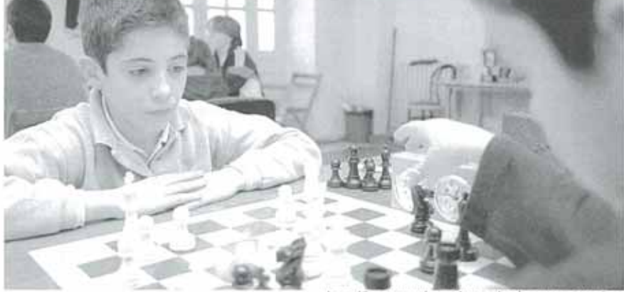
Los niños aprenden a jugar desde muy pequeños, y siempre al ataque ya que de esta forma es más ameno y divertido

Para ello, este joven enseña a sus alumnos a jugar al ataque, la forma más divertida, mientras poco a poco aprenden tácticas y aperturas de la partida: "Es imposible conocer todas las posibilidades