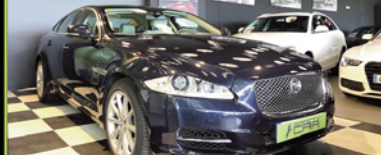
JAGUAR XJ 2013, TDI 275 CV, 131.000 KM