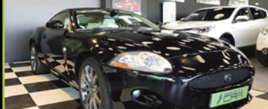
JAGUAR XK 2006, GASOLINA 298 CV, 135.000 KM