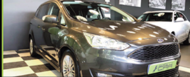
FORD GRAND CMAX 2017, GASOLINA 125 CV, 24.000 KM