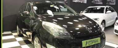
RENAULT SCENIC 2009, DIESEL 105 CV, 144.000 KM