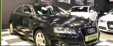
AUDI A3 3 PUERTAS 2011, 1.6 TDI 105 CV