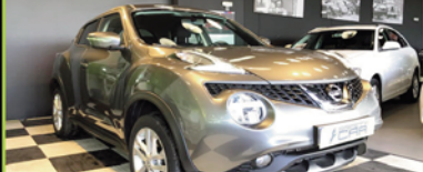
NISSAN JUKE 2017, DIESEL 110 CV, 37.000 KM