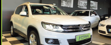
VOLKSWAGEN TIGUAN 2012, TDI 140 CV, 4X4, FULL EQUIPED, SOLO 15.000 KM