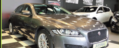
JAGUAR XF 2017, DIESEL 180 CV, 49.000 KM