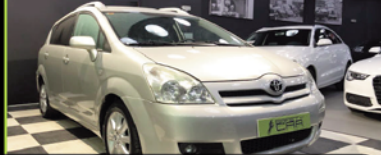
TOYOTA COROLLA VERSO 2007, DIESEL D4D 136 CV, 176.000 KM