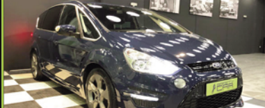
FORD SMAX 2011, GASOLINA 240 CV, FULL EQUIPED