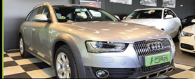
AUDI ALL ROAD 2014, TDI AUTO 177 CV,