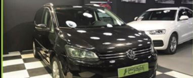
VOLKSWAGEN TOURAN 2011, TDI 140 CV, AUTO, SPORT