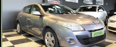
RENAULT MEGANE 2009, DIESEL 105 CV, 89.000 KM