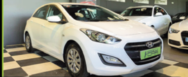
HYUNDAI I 20 2016, DIESEL 110 CV