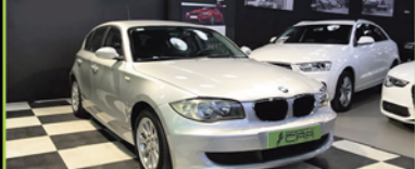
BMW SERIE 1 2006, 120D 163 CV, 179.000 KM