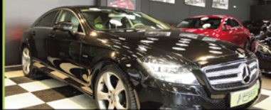
MERCEDES CLS 2010, GASOLINA 292 CV, 164.000 KM