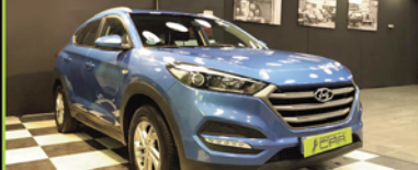
HYUNDAI TUCSON 2017, TDI 114 CV, 69.000 KM,