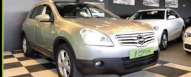
OPEL QASQAI + 2 2009, DIESEL 150 CV, 122.000 KM, 7 PLAZAS