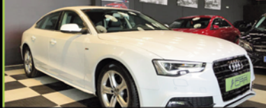
AUDI A5 2013, 42.000 KM, 3.0 DIESEL