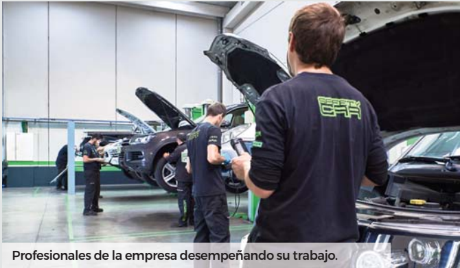
Profesionales de la empresa desempeñando su trabajo.