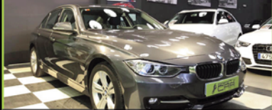
BMW 318 SPORT 2015, 318 DIESEL, PAQUETE SPORT