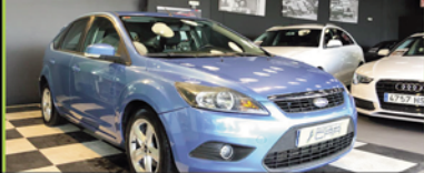
FORD FOCUS 2010, TDCI 90 CV, 136.000 KM