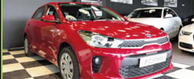
KIA RIO 2018, GASOLINA, 36.000 KM