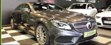
MERCEDES CLS 2015, TDI 258 CV, AMG, 149.000 KM