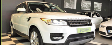
RANGE ROVER SPORT 2014, DIESEL 258 CV, 112.000 KM