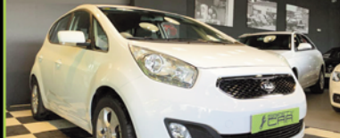
KIA VENGA 2015, TDI 128 CV, 79.000 KM