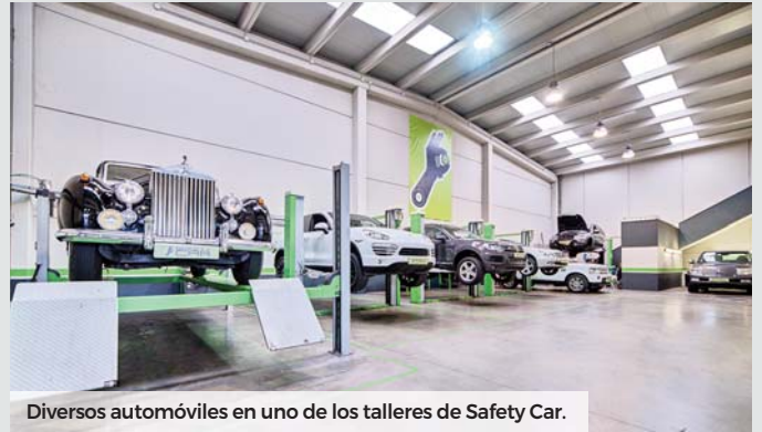
Diversos automóviles en uno de los talleres de Safety Car.