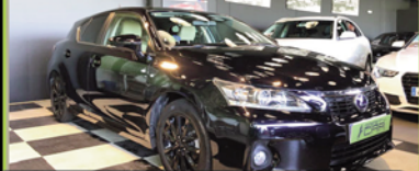
LEXUS CT 200 2013, LEXUS HYBRIDO, 64.000 KM