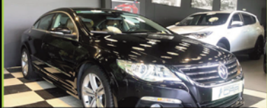
VOLKSWAGEN PASSAT CC 2011, TDI 140 CV, 119.000 KM