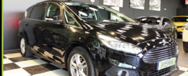
FORD SMAX 2016, DIESEL 150 CV, 7 PLAZAS, DIESEL