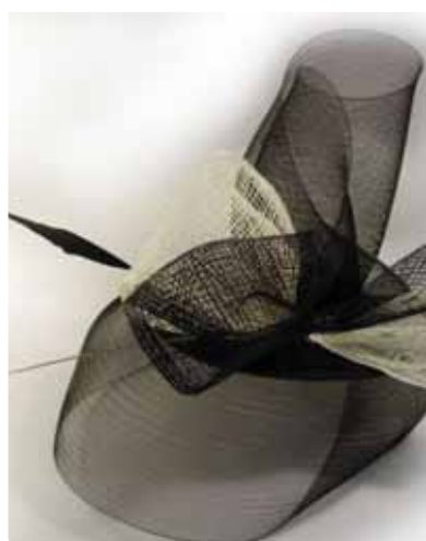
2012, el año de los tocados.

manda. "Para evitar que marque, la mayoría eligen prendas lisas con toque de encaje o puntilla en los laterales", afirma Ana Ocáriz . Como imprescindible en las novias, la liga. "No falla nunca; suelen ser con encaje y con un lazo azul, cumpliendo con una parte de la superstición que afirma que es necesario llevar algo de ese color", concluye.