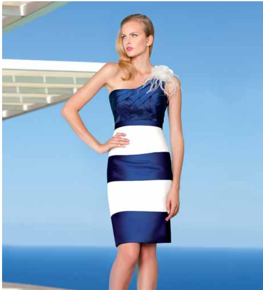
El azulón y los vestidos marcando silueta toman protagonismo en las tendencias de fiesta.

Líneas más rectas que otros años y colores como el azulón marcan tendencia. En complementos triunfan el dorado envejecido y los tocados