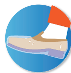
Calzas de protección para los pies