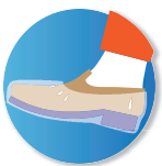
Calzas de protección para los pies