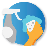
Desinfección profunda y exhaustiva por equipos de limpieza

(Academias de Pamplona y Estella-Lizarrá)