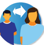
Distancia de seguridad