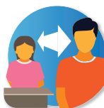
Distancia de seguridad

trabajamos para VUESTRA TRANQUILIDAD Y SEGURIDAD