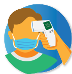
Control de temperatura, a la entrada de nuestros locales.