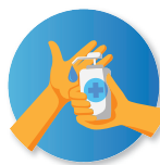
Desinfección de manos constante