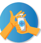
Desinfección de manos constante