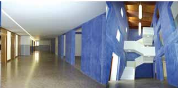
Rehabilitación Convento San Benito